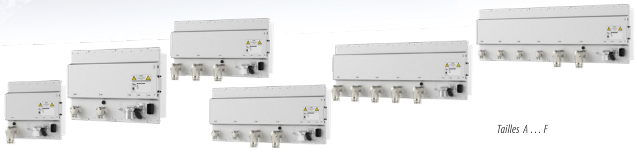
Tailles A... F